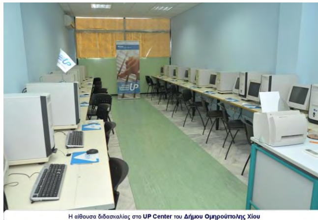
Η αίθουσα διδασκαλίας στο UP Center του Δήμου Ομηρούπολης Χίου