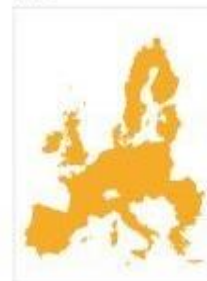
EU 27 YOUTH UNEMPLOYMENT 2013